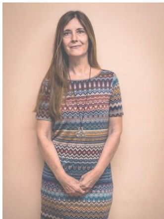
Psicóloga General Sanitaria