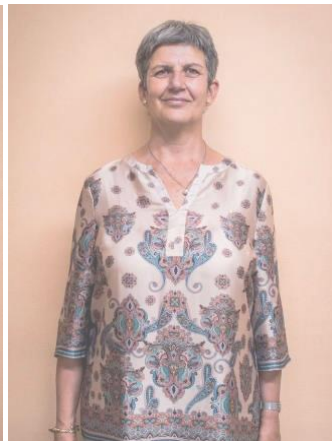
Médico de Familia

Ver perfil profesional en www.institutopna.com